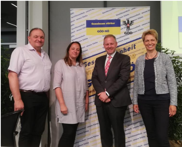
Die Delegation der Gewerkschaft Berufsschule NÖ beim Landeskongress 2021